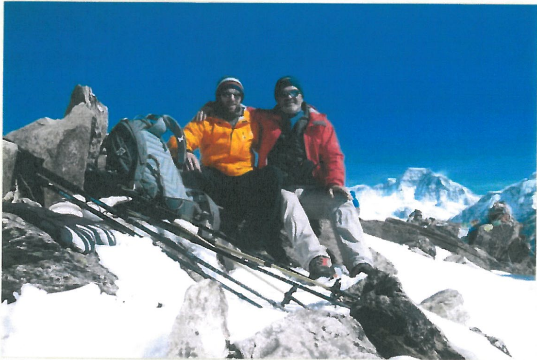
Vater und Sohn in den nepalesischen Bergen