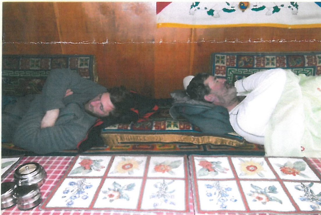
Nach getaner Arbeit ist gut ruhen.

Hier ein paar Einblicke der Bergwelt von Nepal. Wir werden am 26.3.2017 wieder aufbrechen nach Nepal. Ich freue mich schon darauf die Kinder, die Familie und unsere Freunde zu sehen und mit Ihnen Zeit zu verbringen.